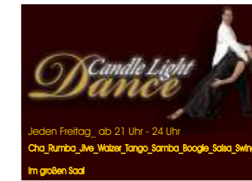
Jeden Freitag, ab 21 Uhr - 24 Uhr Cha_Rumba_Jive_Walzer_Tango_Samba_Boogie_Salsa_Swing Im großen Saal