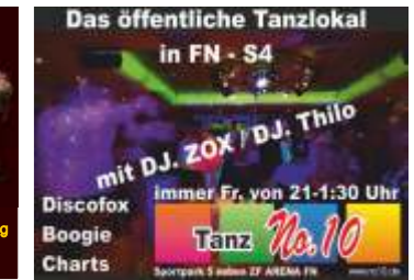
mit DJ. ZOX / DJ. Thilo immer Fr. von 21-1:30 Uhr Discofox Boogie Charts Tanz No.10

Mi. 09.05.18 Alles von Platte mit DJ Thomas ab 20:00 Uhr